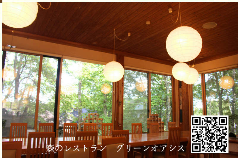
森のレストラン グリーンオアシス

料理はすべて手作り。自然栽培の玄米を使用した酵素玄米が主食。昆布、しいたけのだし作りから始まり、厳選した食材・調味料を使用したヴィーガン自然食です。化学調味料は不使用。お野菜は隣接する水輪ナチュラルファーム光の水自然農園の朝採り完全無農薬野菜をふんだんに使用し、旬にこだわった季節感たっぷりのお食事をお楽しみ頂けます。