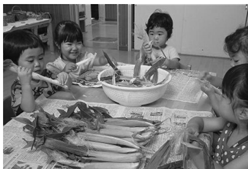
B. 福島県の保育園へ無農薬のお野菜支援