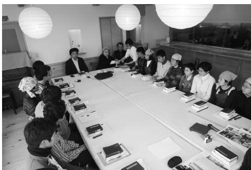
A. 青少年育成公開講座など開催

公益財団法人いのちの森文化財団への寄付は、所得税・相続税・税法上の優遇措置があります。一部の自治体では、個人住民税の寄付金控除の対象となります。いのちの森文化財団から領収書が発行されます。