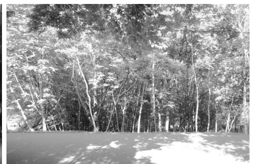
C. ホームホスピス(仮称)建設予定地